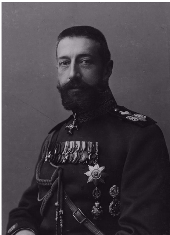
Великий князь Константин Константинович. 1903.

В. Д.: Это, значит, двоюродный брат Александра III?