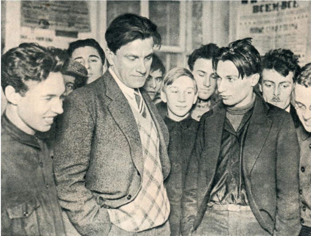
Владимир Маяковский на выставке «20 лет работы», 1930.

После этого, прибивая какой-то плакат, какую-то вещь, Маяковский поднимается по стремянке и достает из кармана пистолет и передает Каменскому: «Вася, – говорит, – поддержи». И остановился уже на стремянке и говорит: «Вот этот пистолет сейчас (он говорил “револьвер”) ничего не значит. Пройдет немного времени – за него будут бороться все музеи».