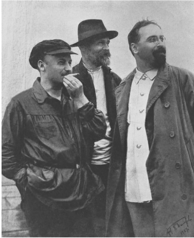
Н. Бухарин, И. Скворцов-Степанов, Л. Карахан. 1928.