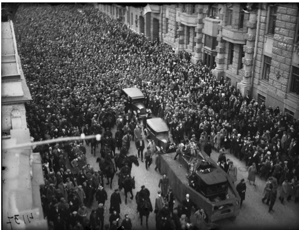
Похороны В. Маяковского. Улица Воровского, 17 апреля 1930 г.