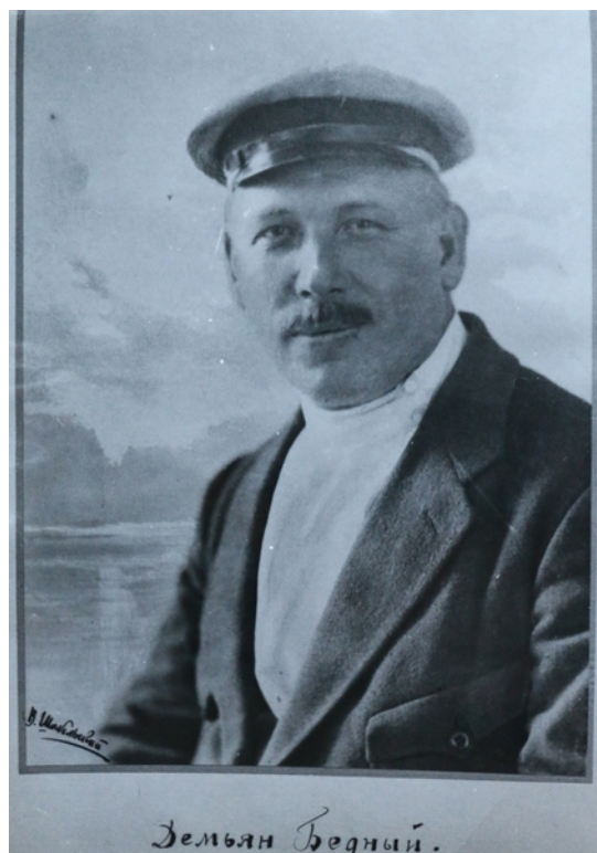
Д. Бедный.

В. Д.: Вы его знали и раньше? Демьяна. Давно?