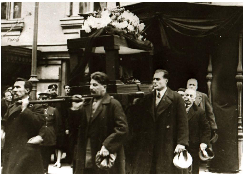
А. Рыков и И. Сталин несут урну с прахом И.Скворцова-Степанова. Октябрь 1928.

И. Г.: Да. Теперь дальше. И когда Скворцов... уже это после апрельского пленума... 126 вообще-то, вторая половина 27-го года, когда Демьян переходил в «Известия», то он обусловил, что Маяковский печататься не будет. Но так как для Скворцова вопрос о печатании Маяковского был решен, то Скворцов-Степанов такое обязательство дал Демьяну Бедному. Как видите, одно другому не противоречит.