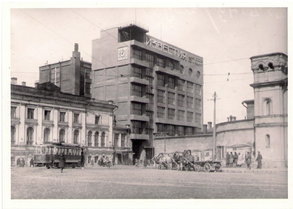
Новое здание «Известий»

Вначале я в «Известиях» короткое время заведовал экономическим отделом, отделом критики и библиографии, затем вошел в редколлегию, затем ЦК утвердил меня заместителем редактора. И после смерти Скворцова-Степанова 68 , в октябре 28-го года я был утвержден главным редактором «Известий» 69 .