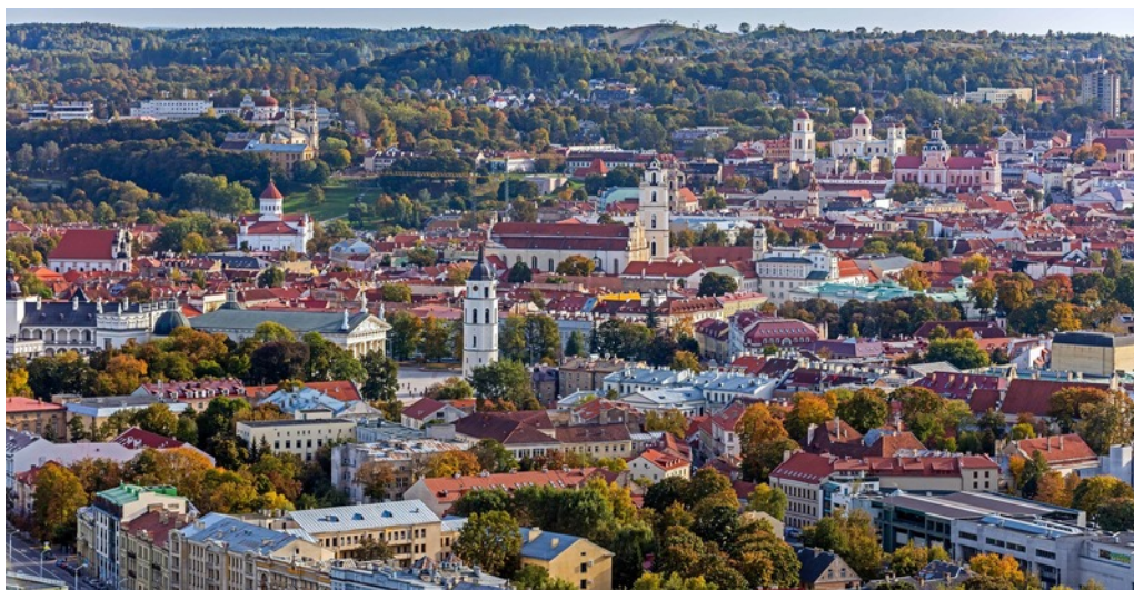
Вид Вильнюса.