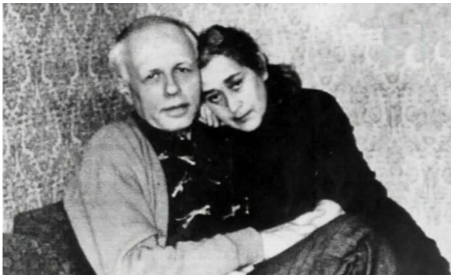
Андрей Сахаров и Елена Боннэр.