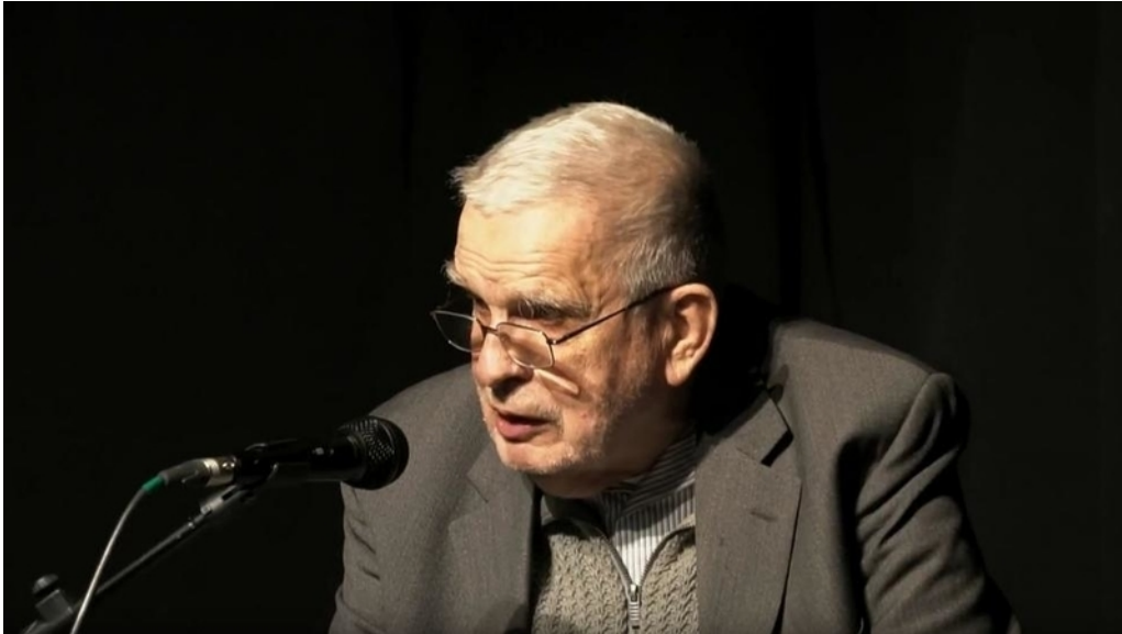
Томас Венцлова.