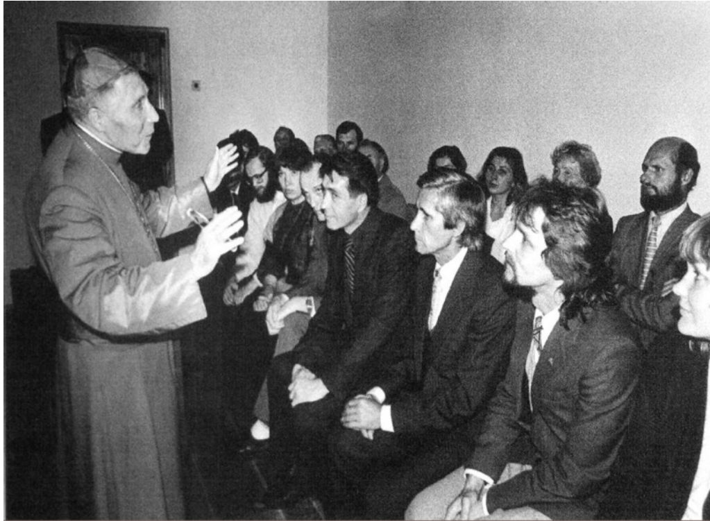
Кардинал Винцентас Сладкявичюс благословляет первых активистов Саюдиса. 2 октября 1988, Паневежис. Источник: www.gulagmuseum.org

Этот Сладкявичюс потом, когда уже, по-моему, когда... Когда Литва отделилась или еще до этого... Я не помню. Короче говоря, Ватикан произвел его в литовские кардиналы. Он самый главный был в Литовской церкви. Очень милый, очень такой... Он больше на сельского батюшку похож. Славный дядька.