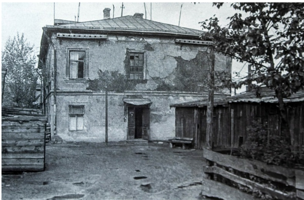
Дом в Марьиной Роще, где в детстве жил мультипликатор Ю. Норштейн. 1970-е гг.