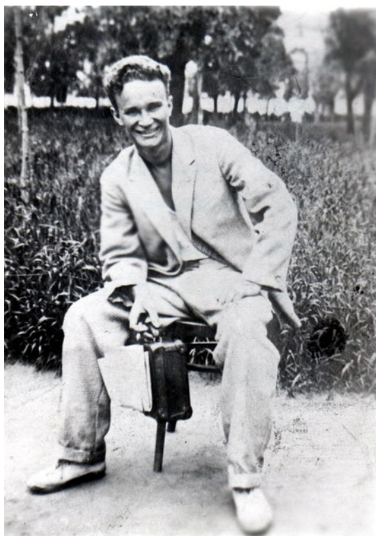
Павел Васильев.

Он жил вот в том доме, 7/9, по Палихе, тоже я на схеме набросаю, как получается. К нему ходили не самого строгого поведения женщины, и он с ними как бы рассчитывался к их отвращению ( со смешком ) томиками своих стихов. Он поэт крупный, сильный, скромный... иногда скромный в жизни. Например, он уступил свою возлюбленную, дочку Кончаловского, ту, которую до революции изобразили в виде капризной, вот так вот осевшей, во всяком случае, предельно избалованная, капризная девка сидит. А потом тот же Кончаловский в странной позе ее изобразил, в розовом платье, завязывающей, согнувшись, ботинки... Вот. В нее был влюблен и Павел Васильев, но он не сумел ее отстоять перед энергичным, нахрапистым, думаю, Сергеем Владимировичем Михалковым. Просто, когда будете там, то... То есть это зона и этого тоже.