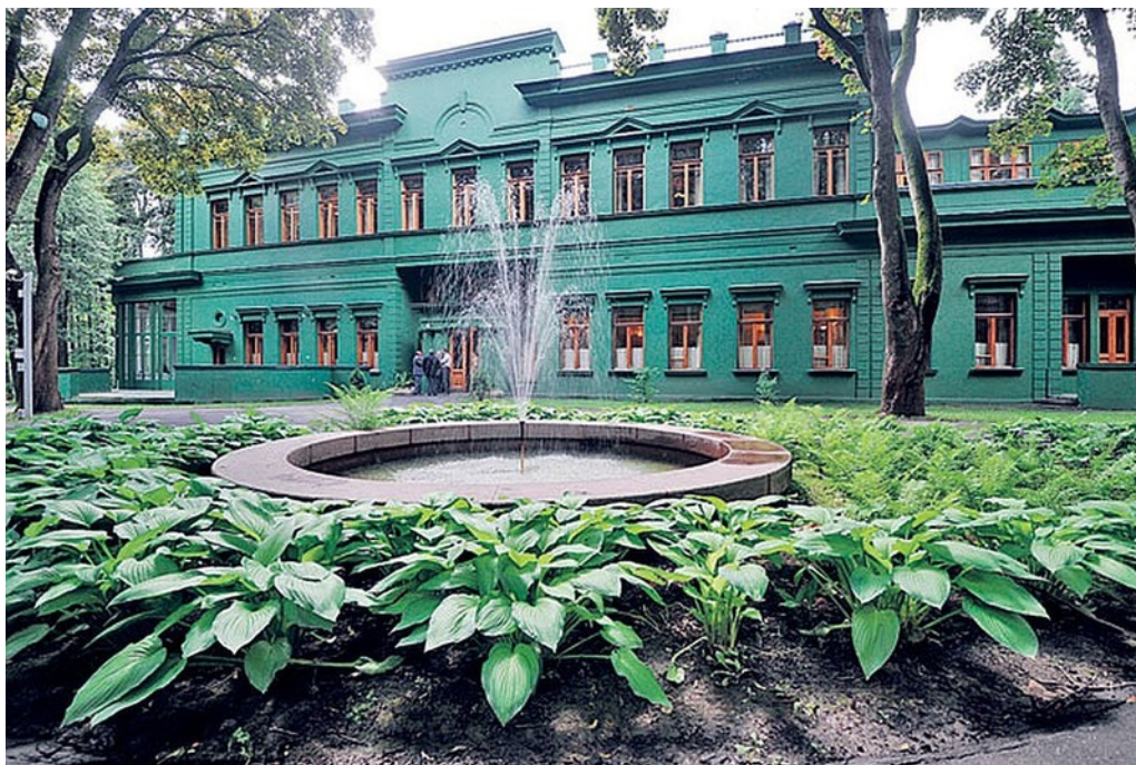
Ближняя дача И. В. Сталина.