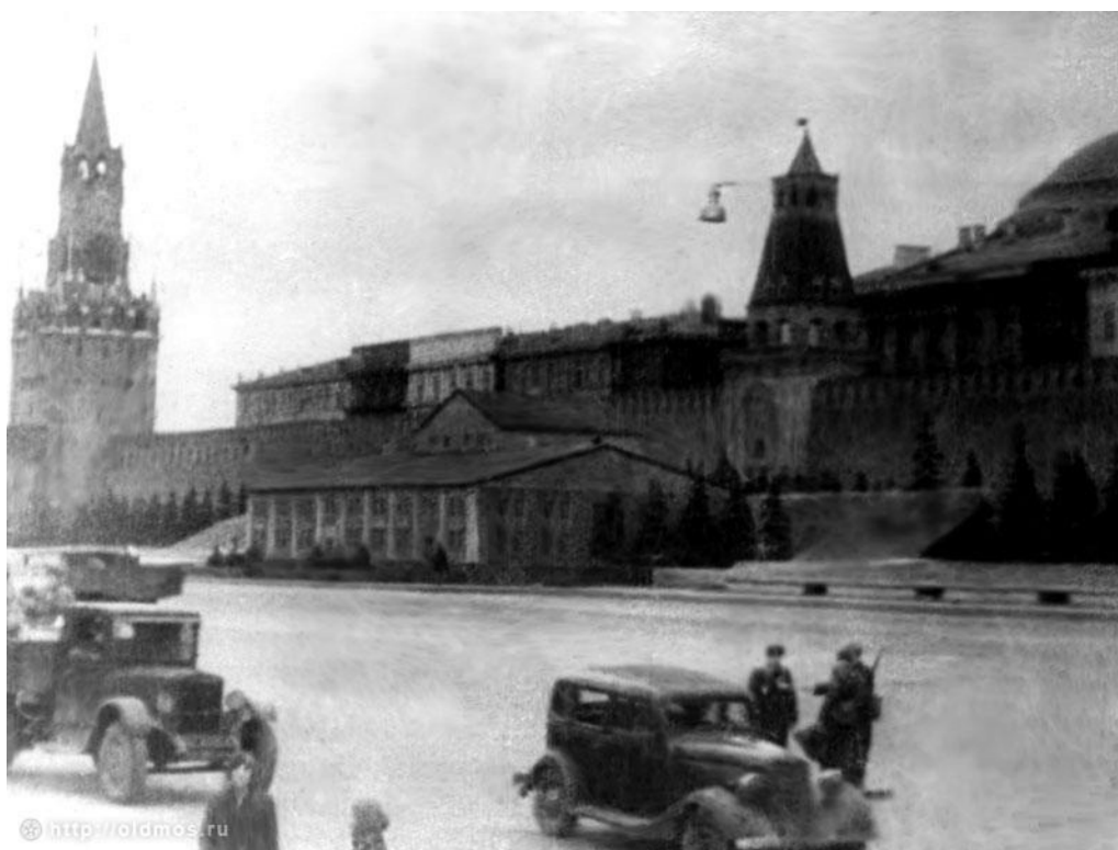
Маскировка мавзолея В. И. Ленина.