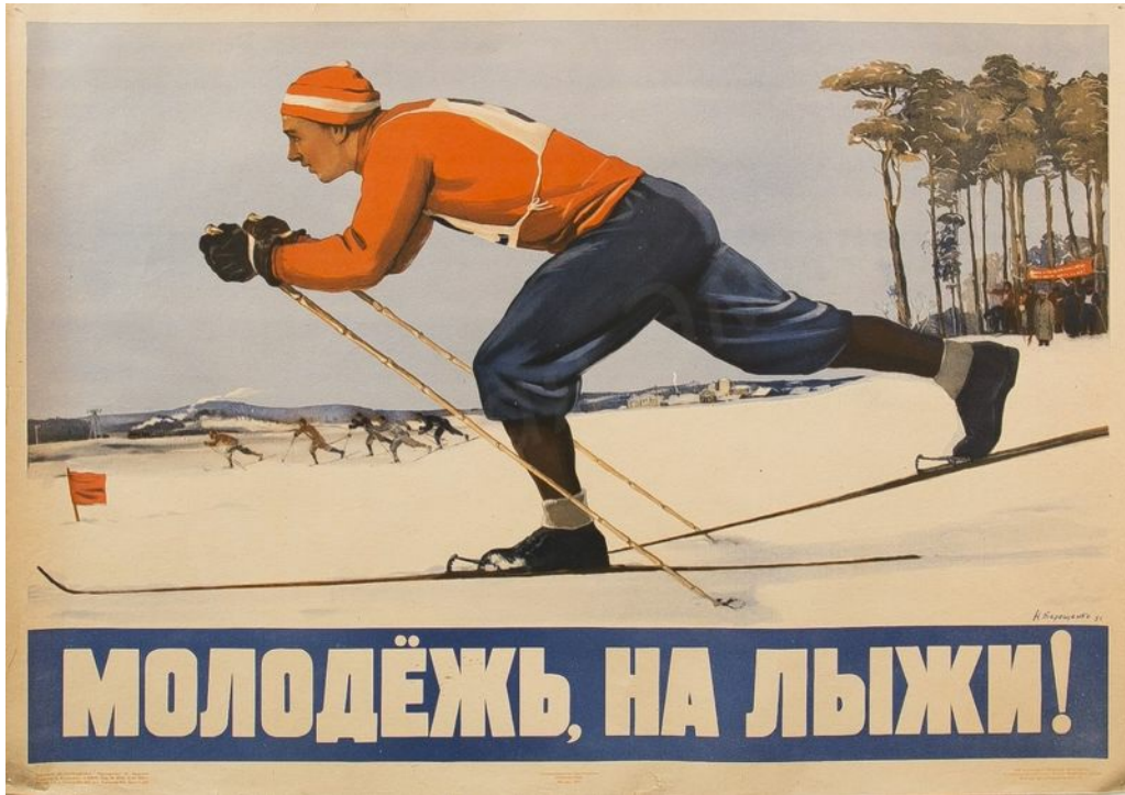
Терещенко Н. И. Плакат «Молодежь, на лыжи». М.: «Искусство», 1951. Размер – 57x81 см.

Н. С.: А буфеты какие-то работали? Можно было там чаю горячего выпить?