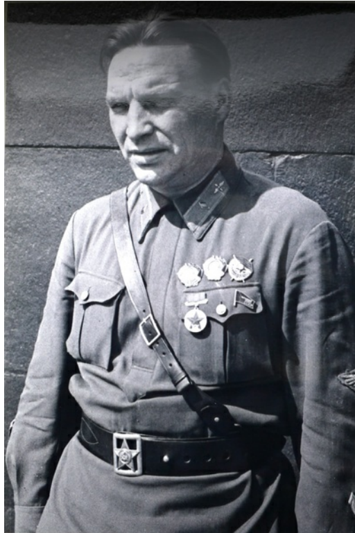
Валерий Чкалов.