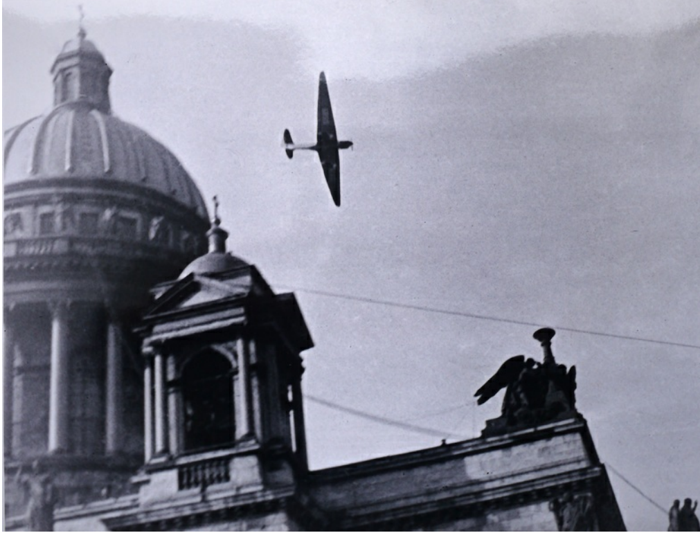
Самолет Валерия Чкалова над Исаакиевским собором.