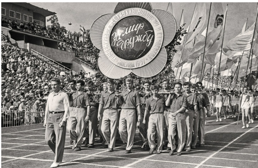
Открытие Всемирного фестиваля молодежи и студентов в Москве. 1957.

О. Ч.: В Лужниках. В Лужниках было открытие. Ну и потом, конечно, Москва была такая очень... Я не была там никак задействована. Вот чтоб я там была каким-нибудь волонтером или что-то — нет. Это все был взгляд со стороны.