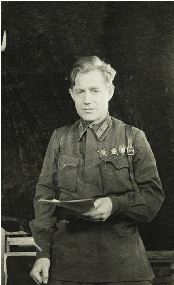
А. А. Сурков в редакции газеты «Правда». Москва, 1942.

В 53-м году, когда умер Сталин, произошла передвижка. Фадееву надо было избавиться от Софронова, который был его правой рукой в Союзе писателей. Когда надо было подписывать вот эти согласия на арест писателей, то Софронов подписывал эти самые бумажки. Он вообще весь в крови, как говорится. Он был жуткий тип. Я уже не говорю, что он был одним из первых, кто раздувал антисемитскую кампанию. Он же сделал доклад соответствующий про борьбу с космополитами. И тут же пошли его пьесы в театрах, и тут же две Сталинские премии получил за свои пьесы, хотя пьесы были никудышные. Короче говоря, Софронова Фадеев прислал в «Огонёк» главным редактором, а Сурков ушел в Союз писателей первым секретарем, а тот [Фадеев] был как генеральный секретарь. В общем, второе лицо.