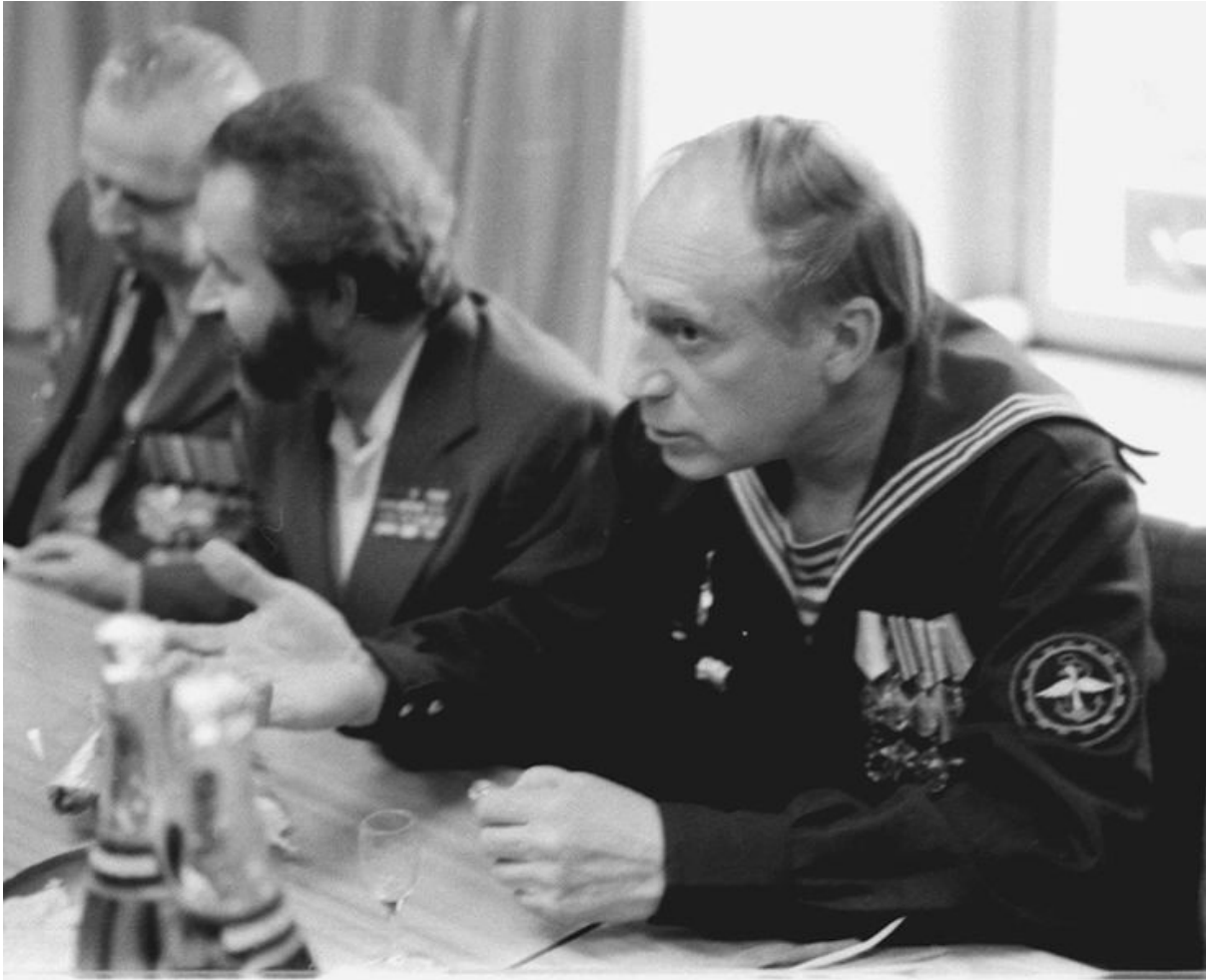
Ю. М. Кривоносов. Москва, 1985.