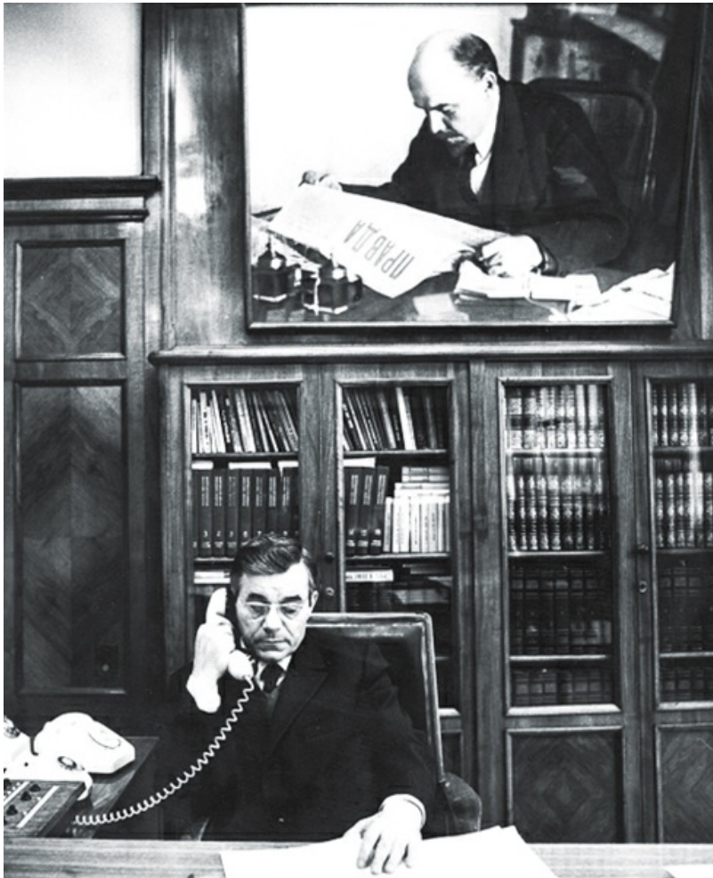
М. В. Зимянин в редакции газеты «Правда». Москва, 1970-е гг.

В разгар этого дела я по каким-то делам прихожу к Софронову. Я же должен к нему приходиться, я партийный секретарь. Я прихожу по какому-то делу, а у него был такой драматург Георгий Мдивани. Жорж Мдивани, драматург. Что-то он у него сидел, что-то он с ним разговаривал, что я, мол, затеваю. Я говорю: «Ну, что затеваю? Я веду свою работу. Это мне положено». Знаете, что он сказал? «Я люблю борьбу», — сказал Софронов. Я ему говорю: «А это не борьба. Это война». Все, и я ушел. Иду по коридору. Навстречу мне идет этот Жорж Мдивани, который от него вышел, кидается ко мне и жмет мне руку. Что он хотел сказать? Может, я ему понравился ( смеется ). Может, он Софронова тоже ненавидел. Я даже не знаю. Короче говоря, вот такая штука.