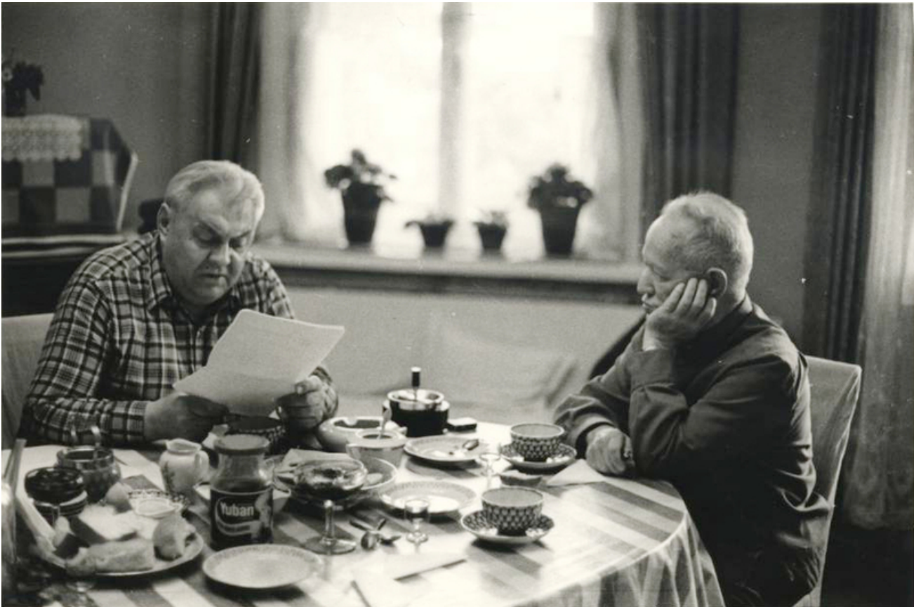
А. В. Софронов и М. А. Шолохов. Станица Вёшенская, 1974.

Они ему дают без занесения, а отдел пропаганды его не освобождает. До этого он пытался найти защиту у Шолохова, своего дружка, звонил ему. Шолохов никогда не брал трубку. Нет его, не брал. Он с ним не разговаривал ни разу. Он думал, что того могут из партии выгнать. Когда он узнал, что его из партии не выгнали, тогда он позвонил Кириленко: «Слушайте, помогите! Настоящий, хороший советский писатель! Надо ему помочь!» И Кириленко позвонил в отдел пропаганды, а там в это время даже не было заведующего отделом, был только заместитель. Временно отсутствовал заведующий отделом. Кириленко говорит: «Пусть работает». И его оставляют работать. Таким образом они этот комитет обманули.