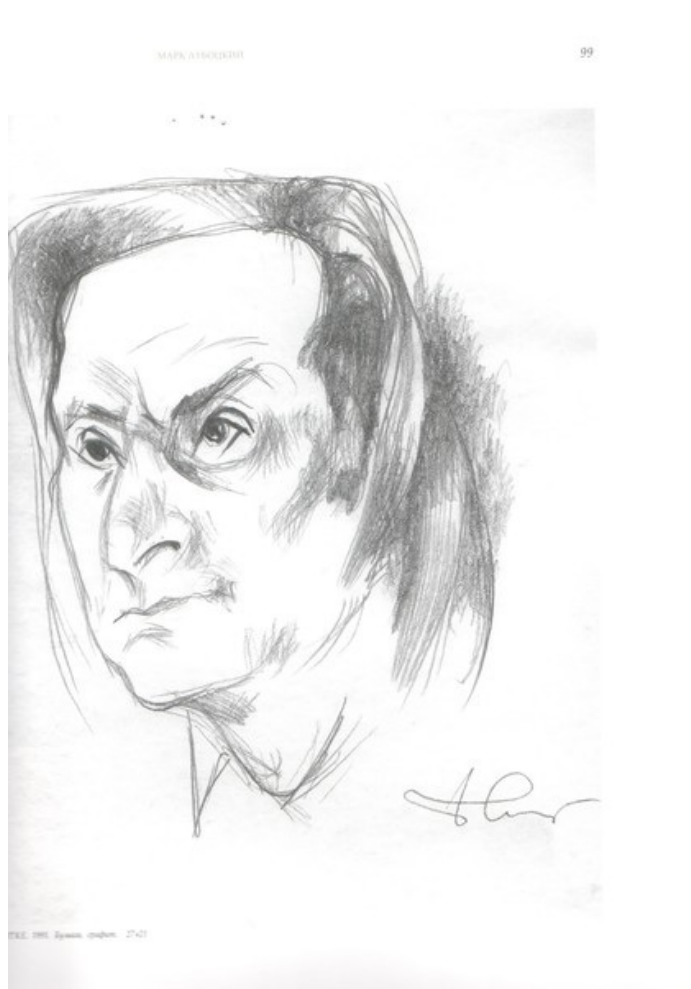
Б. Жутовский. Альфред Шнитке. 1991