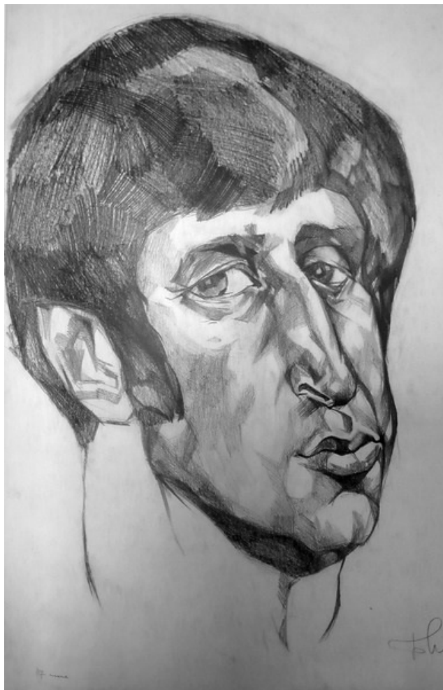
Б. Жутовский. Владимир Янкилевский. 1973