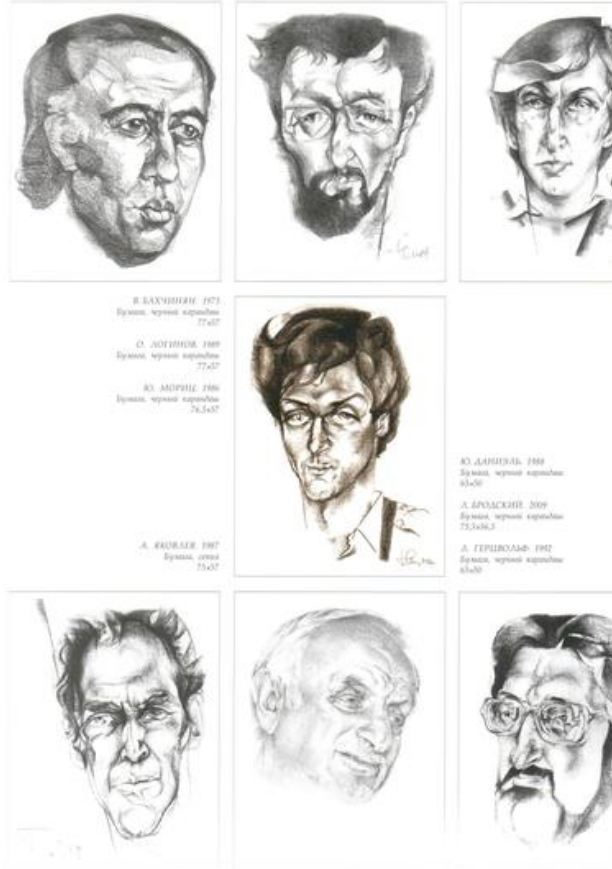
Б. Жутовский. «Портреты века»