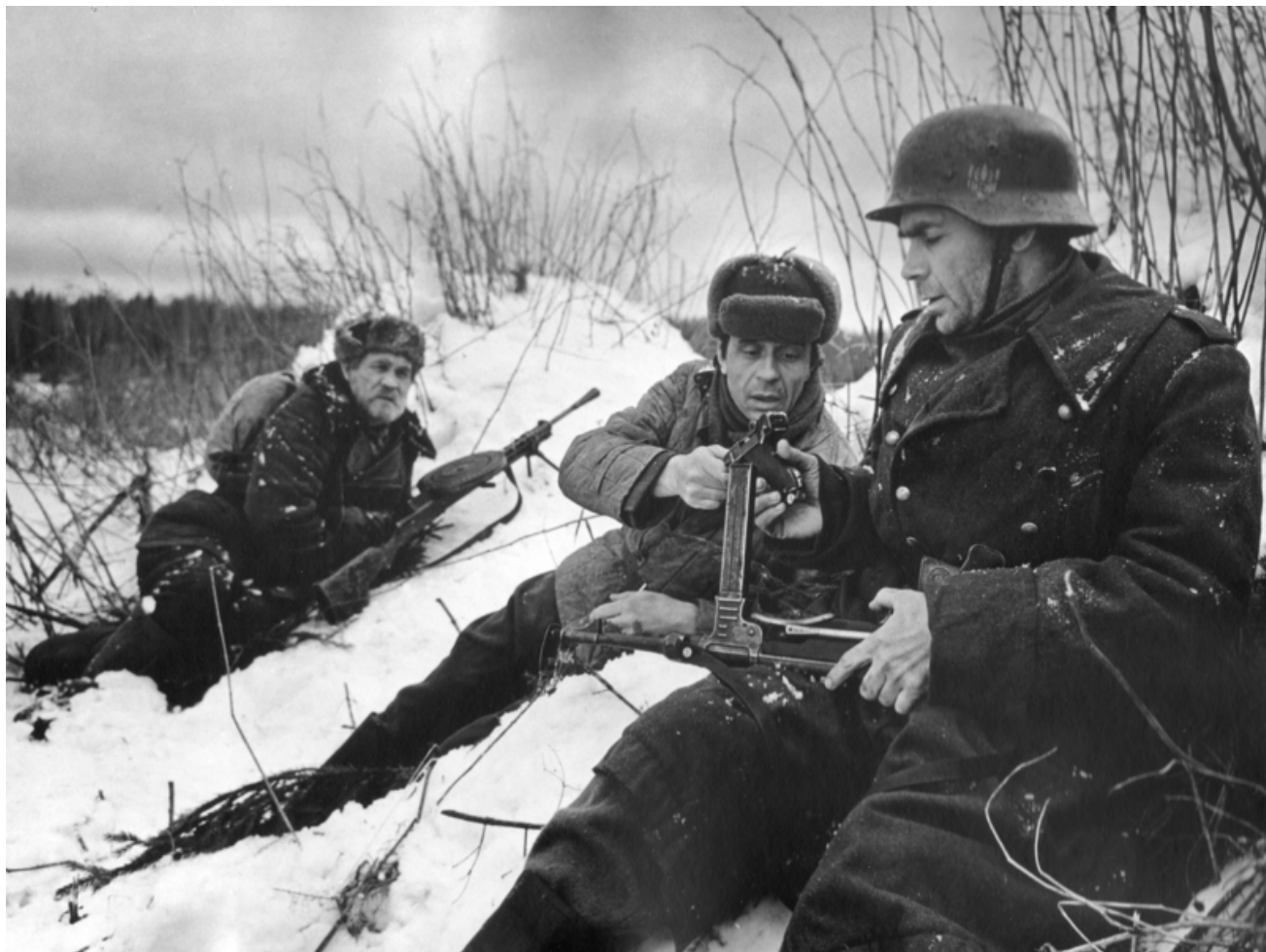
Проверка на дорогах. Кадр из фильма

Е.О.: А как все-таки люди работают вдвоем? Это обсуждение все время идет, да? Кто-то идеи кидает, кто-то разрабатывает? Как это происходит?