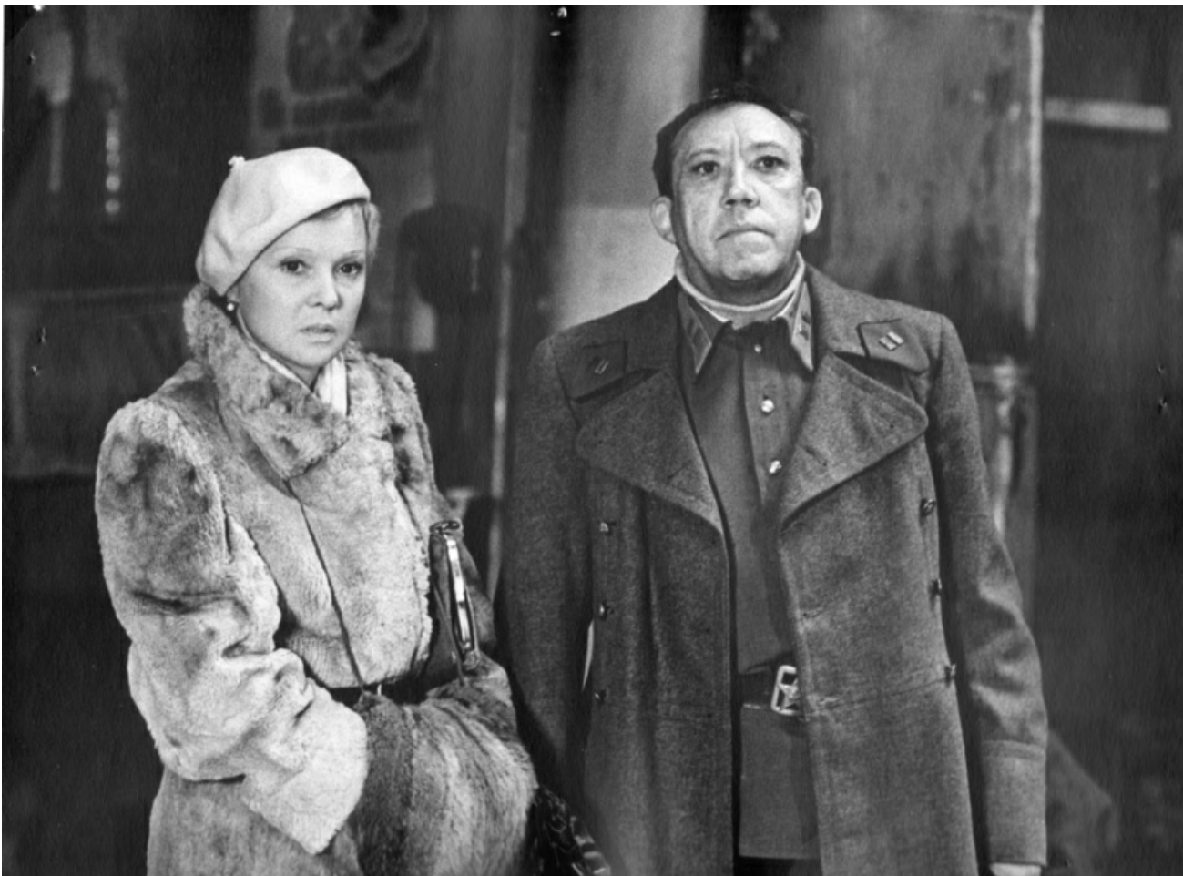
Кадр из фильма «20 дней без войны»