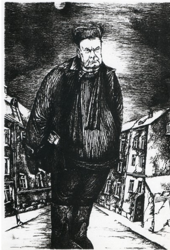
Алексей Герман.