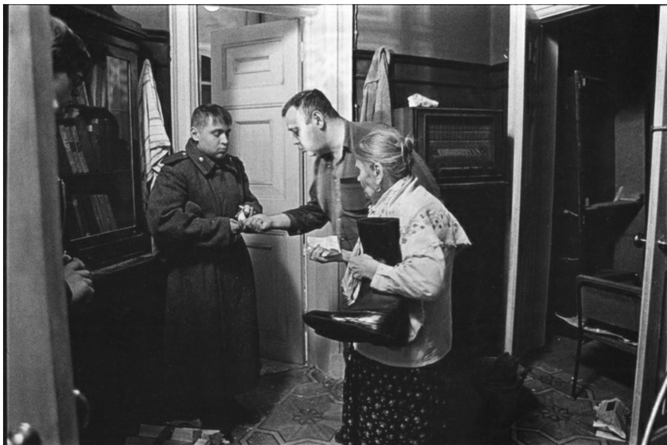
«Хрусталеv, машину!» (Рабочий момент)

Е.О.: Но представить это очень трудно. Последнее: хотела задать такой вопрос. Были сложные времена — как вы выживали? Какие были ресурсы? Как это было?