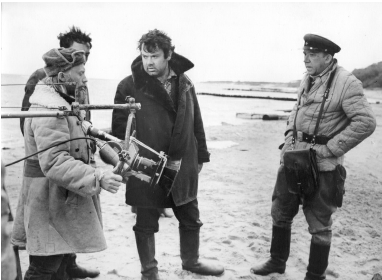
«20 дней без войны» (Рабочий момент)