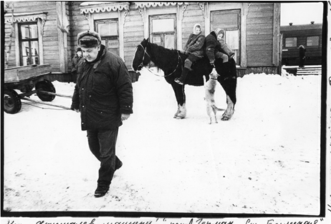
«Хрусталеv, машину!» (Рабочий момент)