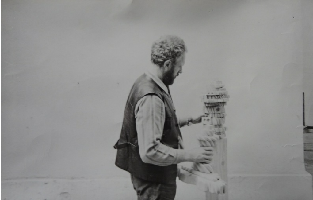
Около мастерской. 1974 год