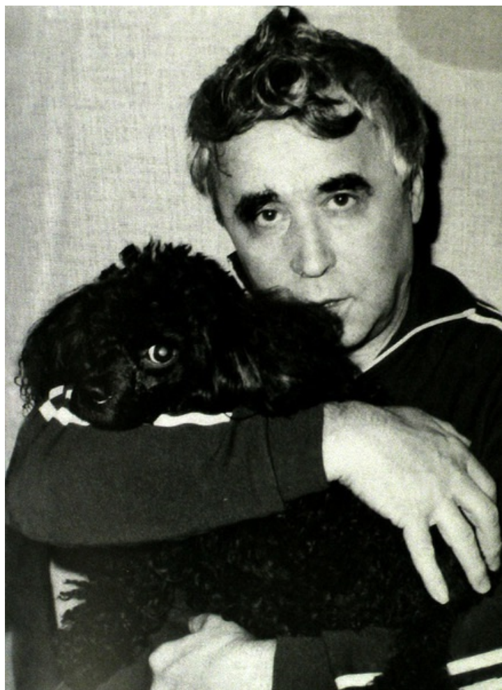
После разгона Верховного Совета СССР на даче в Переделкино. 1993 г.

Решающую роль в распаде Советского Союза, с моей точки зрения, сыграли: политический фактор, другой фактор — умонастроения массы и третий — случайный фактор. Первый, политический фактор, состоял в том, что к власти рвался Ельцин. Ему нужна была платформа и свобода рук, чтобы убрать Горбачева.