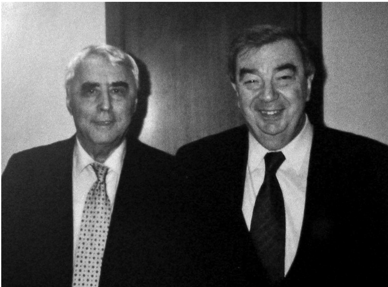
С академиком Е.М. Примаковым. 2003 г.

Ф.Б.: Это были, в основном, хитрые, и в меньшей степени образованные и умные люди. То есть по серьезному счету умные.