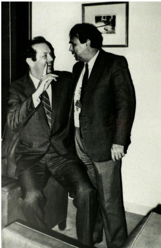
С вице-президентом США Альбертом Гором. Вашингтон, Белый дом, 1992 г.

Д.С.: То есть Сталин и тогда был фигурой разъединяющей?