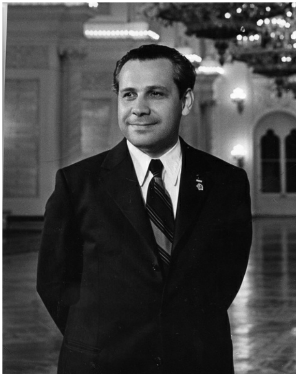
Москва, 1974 год

М.Н.: Я имею в виду инициативу в 60-х по введению этой дисциплины по всей стране. И есть ли у вас отношение какое-то к ней?