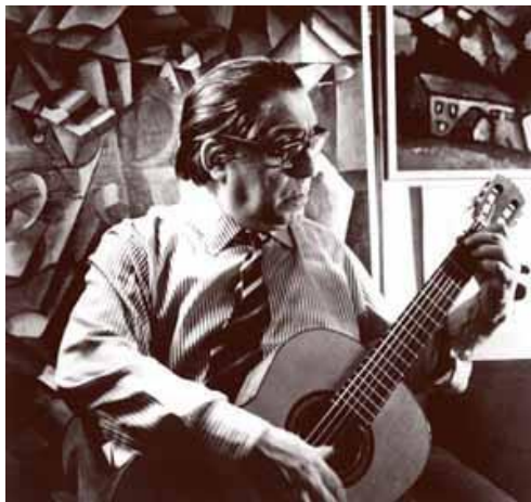
Георгий Дионисович Костаки