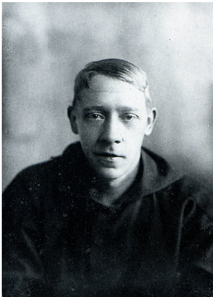
Владимир Евграфович Татлин