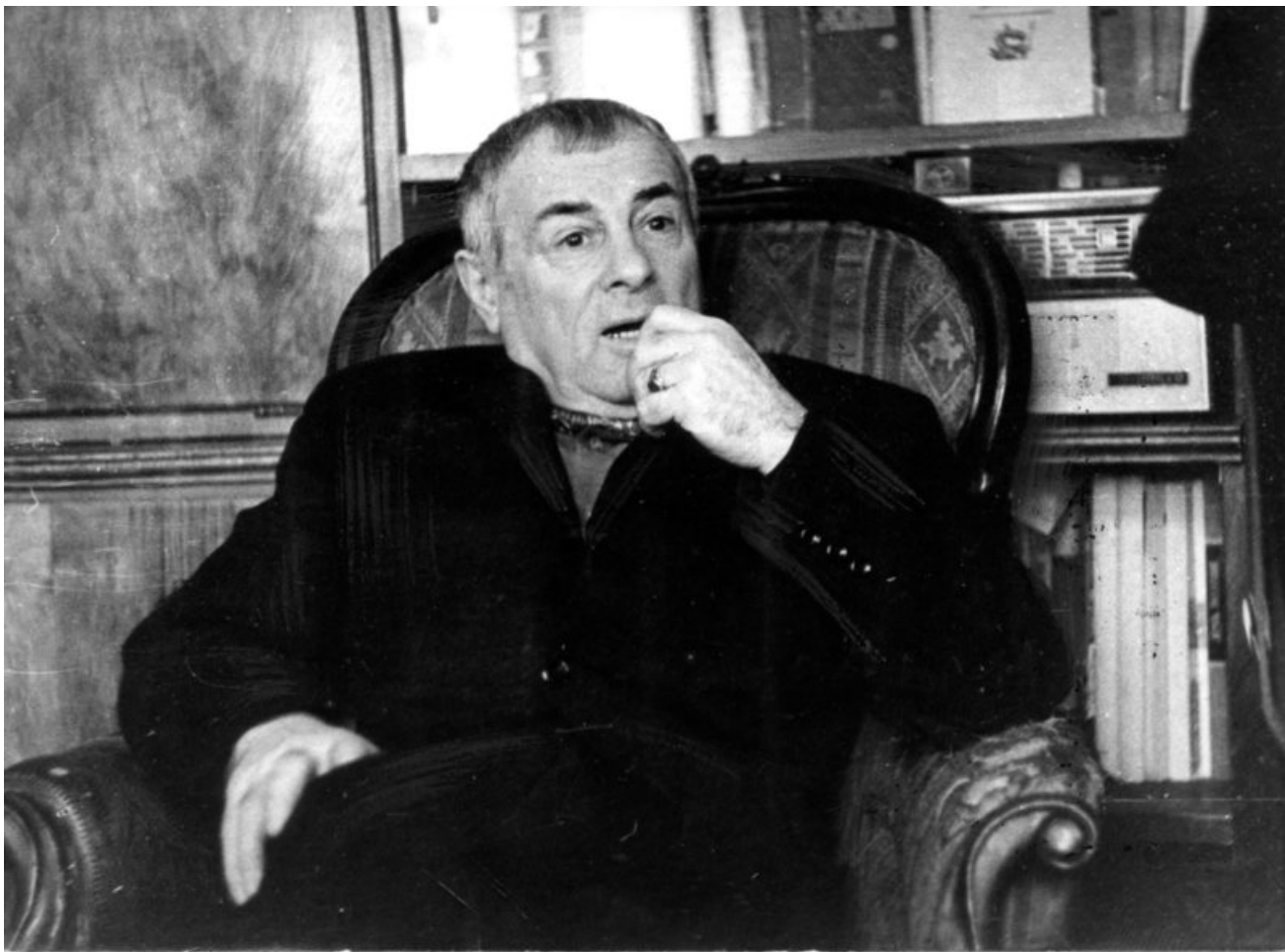
Александр Григорьевич Тышлер