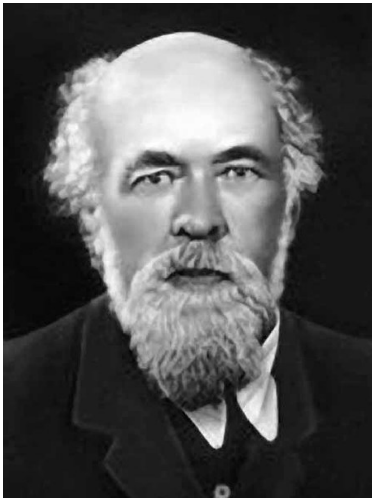
Александр Александрович Веснин